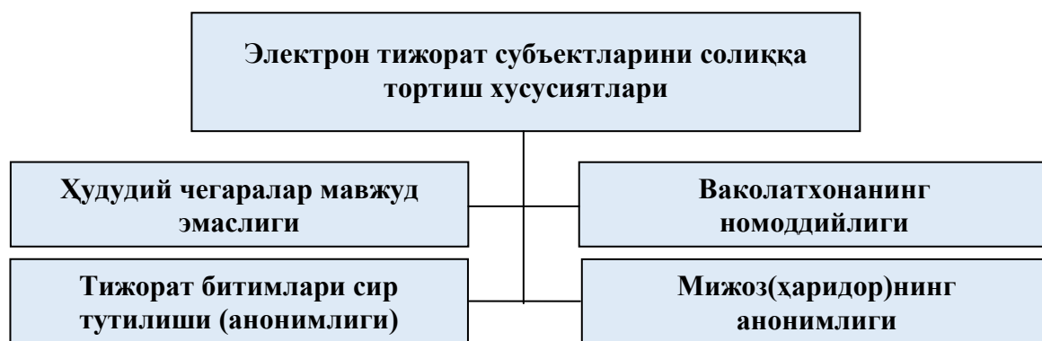
3-расм. Электрон тижорат субъектларини солиққа тортиш хусусиятлари 16

Электрон тижоратнинг устунликлари тадбиркорлик фаолиятининг йўналиши сифатида истиқболга эга эканлигида намоён бўлмоқда. Аммо ушбу устунликлар давлат бюджетида сезиларли йўқотилишларга ҳам омил бўлмоқда. Шу сабабли, глобал Интернет тармоғи муҳитида солиққа тортишнинг мос платформаларини ишлаб чиқиш ва солиқ назоратини автоматлаштиришга қаратилган тамойилларини қўллаш зарурияти сабабли электрон тижоратнинг ўзига хос хусусиятларини аниқлаш ва уларни солиққа тортишда инобатга олиш муҳим ҳисобланади. Бундай хусусиятлар сифатида(3-расм):