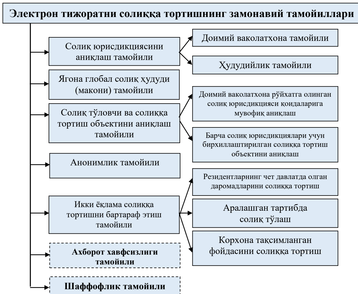
2- расм. Электрон тижоратни солиққа тортишнинг замонавий тамойиллари 15

Л.Фролова 14 томонидан электрон тижоратнинг хусусиятларини ҳисобга оладиган замонавий солиққа тортиш тамойилларини белгилаб олиш масалалари илгари сурилган.