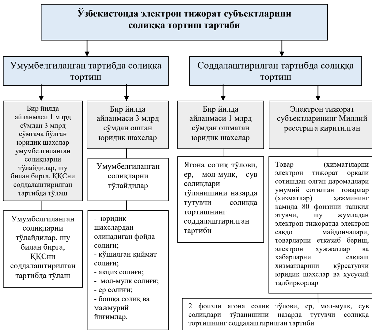
4-расм. Ўзбекистонда электрон тижорат субъектларини солиққа тортиш тартиби 17

янгилашларни етказиб бериш каби хизматларни келтириб ўтиш мумкин. Бу хизматлар уларнинг сотувчиси фаолият кўрсатаётган жойда реализация қилинган, деб ҳисобланади. Мас равишда агар уларнинг миллий ташкилот кўрсатаётган бўлса, улар Ўзбекистон ҳудудида реализация қилинган ҳисобланади ва қўшилган қиймат солиғига тортилади. Бундай хизматларга солиқнинг ноллик ставкаси татбиқ этилмайди. Масалан, Европа Иттифоқи мамлакатлари истеъмолчиларига Ўзбекистондан сотувлар амалга оширилганда қўшилган қиймат солиғининг бундай икки мартаб тўланиши ва Европа Иттифоқи мамлакатларидан амалга оширилган сотувларда унинг тўланмаслиги ҳам мумкинлиги Ўзбекистон ташкилотларига ноқулай шароит яратади. Ушбу ҳолатда миллий электрон маҳсулот экспортчи компанияларига нисбатан дискриминация кузатилади, чунки улар ўз истеъмолчиларининг қаерда жойлашганлигини аниқлаш учун серхаражат таҳлил ўтказишлари, шунингдек Европа Иттифоқи мамлакатларидан бирида солиқ ҳисобига ўтиш учун сарф-харажат қилишлари лозим бўлади.